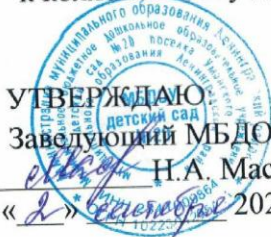
График сменности работы сотрудников МБДОУ № 20 на 2021 – 2022 учебный год

УТВЕРЖДАЮ Заведующий МБДОУ № 20 Н.А. Масьянова « 2 » Сентября 2021г.